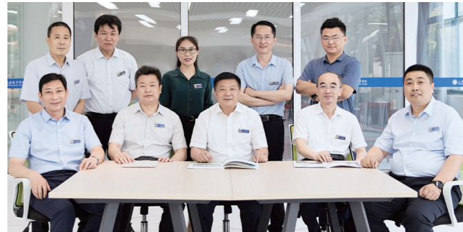
国家级职业教育教师教学团队