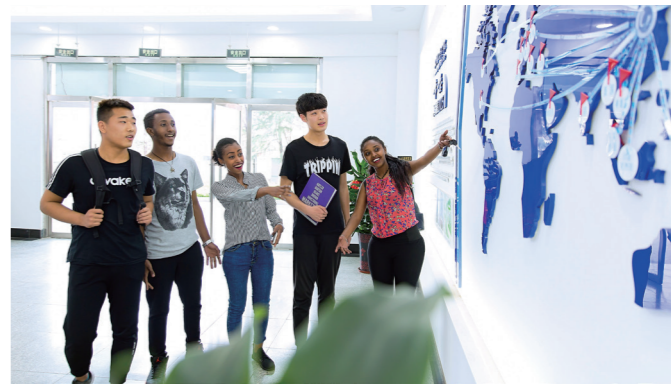
我院中外学生共同学习交流