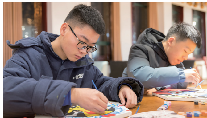
传统文化育人成为学院的亮点

发挥校办产业育人功能。推动校办产业与学院专业建设、科研创新、师资队伍建设和实训、社会服务、学生技能培训、后勤保障、融资等各项工作的深度融合,促进校办产业在学院人才培养中发挥更大作用。