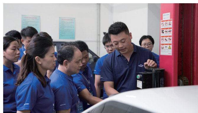
我院连续7年承接中德诺浩全国“双师型”教师资格培训任务