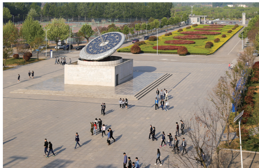
优质校带来的“红利”,让师生能够幸福地工作、学习与生活。

坚持创新发展、内涵发展、特色发展、开放发展、全面发展原则,紧扣经济转型升级和供给侧结构性改革要求,服务中国制造2025国家战略和“一带一路”倡议,全面深化教育综合改革,创新适应经济社会发展和学生全面发展需要的体制机制,促进产教深度融合、校企深度合作,激发内生动力;对接区域重点产业,新旧动能转换十强产业转型升级,重点将5个优势专业群建成品牌专业群,整体提升专业发展水平和人才培养质量;培养造就一批社会知名度高、行业影响力大的教学名师、专业带头人和领军人才;打造技术技能积累与创新载体,建设一流的科研创新、技术服务和专业教学团队,提升科技研发和社会服务能力,服务国家战略和区域经济发展;全面提升信息化应用水平,重构教育教学新生态;坚持“引进来、走