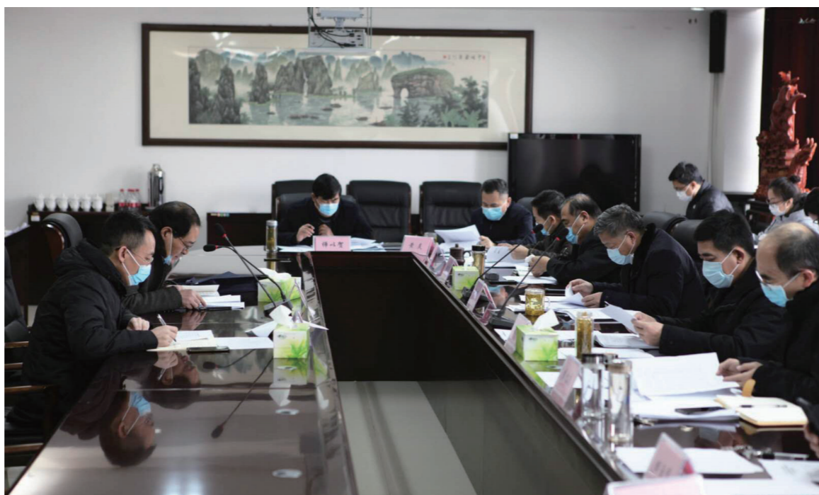
学院党委听取二级专业学院汇报2020年工作要点

年一项重点工作,会上各部门、二级专业学院汇报了优质校各项指标完成情况以及今年的工作要点。学院承担的教育部和山东省现代学徒制试点项目顺利通过验收,光伏发电技术与应用教师团队成功入选首批国家级职业教育教师教学创新团队,智能制造等3个基地认定为国家级生产性实训基地,机电一体化技术等3个专业获认定为国家级骨干专业,在12个领域的19个专业开展1+X证书制度试点并完成首批5个领域的证书考试工作。创新创业工作广受好评,举办第十四届全国高职院校“发明杯”大学生创新创业大赛。新增海外友好合作院校4所,成立俄罗斯孔子六艺学堂和第三所泰国孔子六艺学堂,国际影响力不断加强。学院体制机制改革不断创新,人才培养质量不断提升,技术技能积累不断加强,国际化发展步伐加快,管理服务水平持续优化。