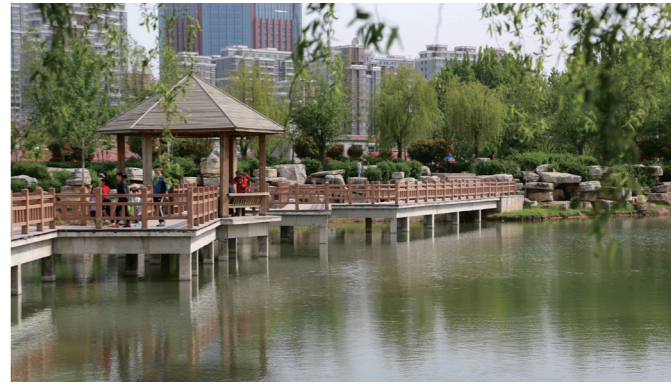
“绿色、人文、智慧、和谐”的校园环境文化。