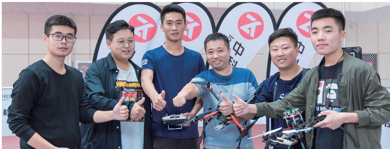
近年来,学院培养出越来越多的创新型、发展型、复合型高素质技术技能人才