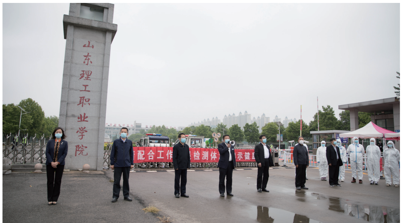
学院党委领导出席开学演练现场