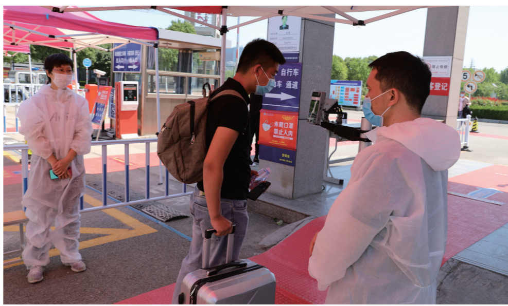
测量体温并进行人脸识别后进入校园

为迎接第一批返校学生,学院高度重视,制定了细致完善的春季返校方案,多次召开专题会研究部署,针对学生返校后的各类场景及突发情况应急处置作了模拟演练;提前展开摸排工作,精准掌握申请返校学生的健康状态、返校缘由、行程安排,并定时进行校园公共区