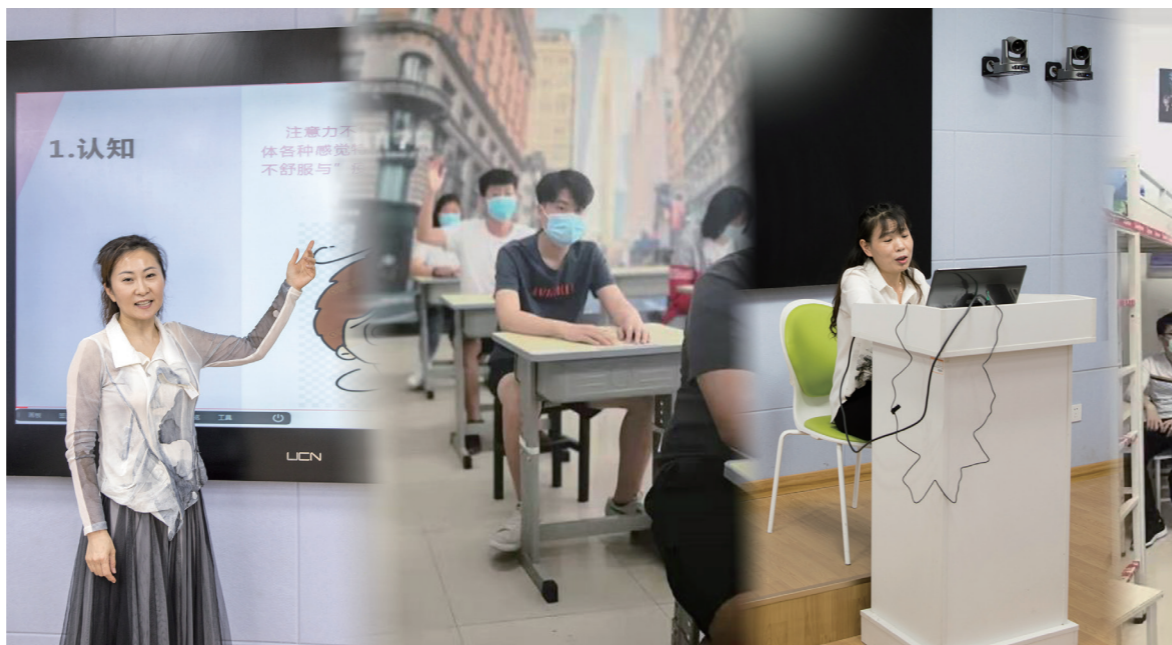
学院开展形式多样的“开学第一课”

今年是五四运动101周年,也是中国共产党成立98周年。为弘扬爱国、进步、民主、科学”的五四精神,在团员中营造浓厚的学习氛围,进一步增强团组织的凝聚力、战斗力,学院开展了主题为“五四精神 传承有我”的线上团课活动。