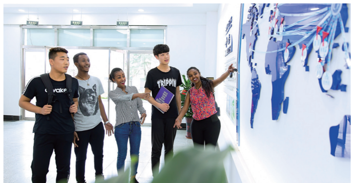
中外学生共同学习交流