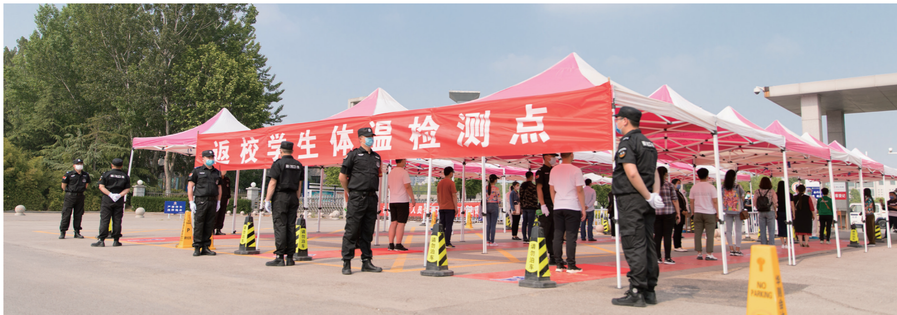
学院做好充分准备迎接学生返校